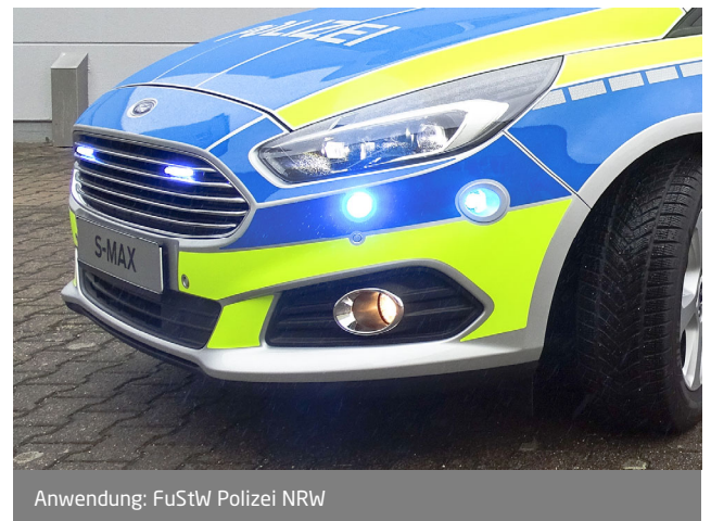
Anwendung: FuStW Polizei NRW